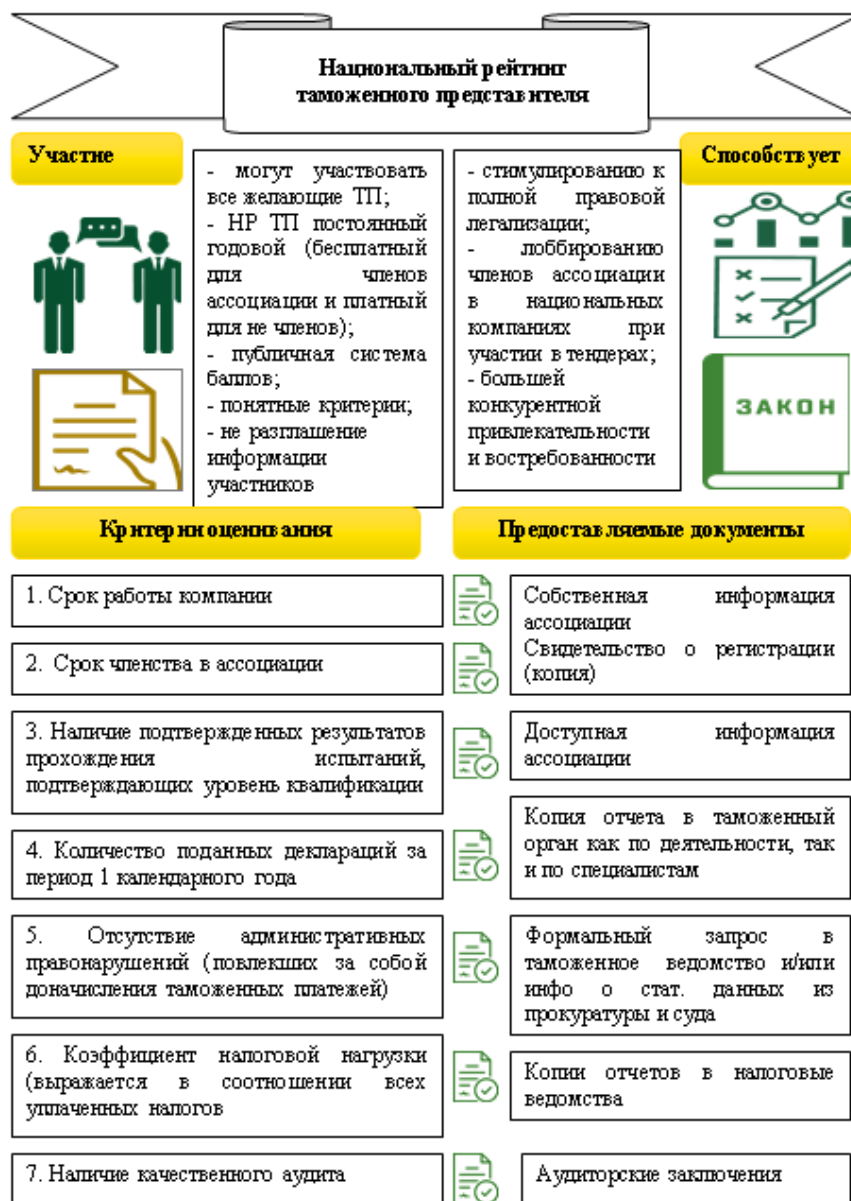
Рис.3. Проект национальной рейтинговой системы ТП

В рамках Международного таможенного форума Председатель Казахстанской