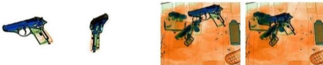
Рис. 4. Пример наложения двух проекций пистолета на две проекции объекта контроля при использовании досмотрового рентгеновского аппарата

Оптимальным является формирование базы «опасных предметов» в нескольких проекциях и при использовании многопроекционных досмотровых рентгеновских аппаратов наложении их на соответствующие проекции объекта контроля (Рис. 4).