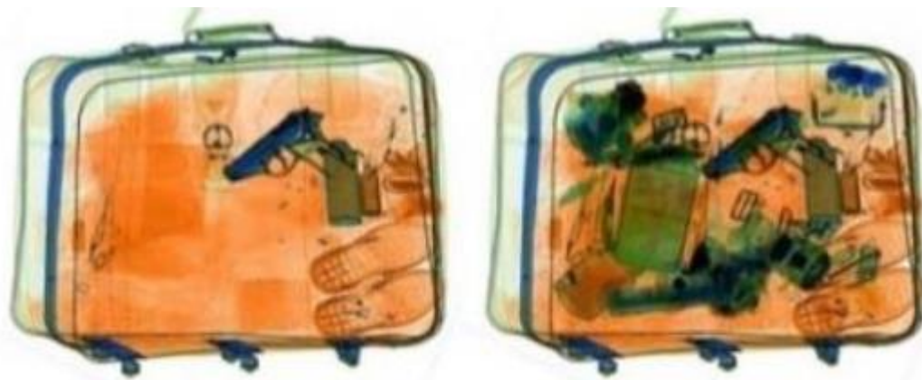
Рис. 3. Пример неудачного (слева) и удачного (справа) наложения «опасного предмета» на объект контроля с точки зрения его несоответствия другим находящимся в нем предметам

предварительно записанные опасные предметы с рентгеновскими изображениями реальных объектов контроля на экране досмотрового рентгеновского аппарата. С этой целью при размещении ИОП необходимо рассчитать, как рентгеновский луч проходит через «опасный предмет» и другие предметы, находящиеся перед ним или за ним, и оценить соответствующую информацию о цвете и яркости полученного изоб-