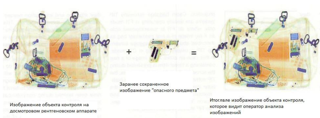
Рис. 1. Процесс формирования изображения на экране досмотрового рентгеновского аппарата при использовании технологии ИОП

работа также становится более интересной и мотивированной [13, 14].